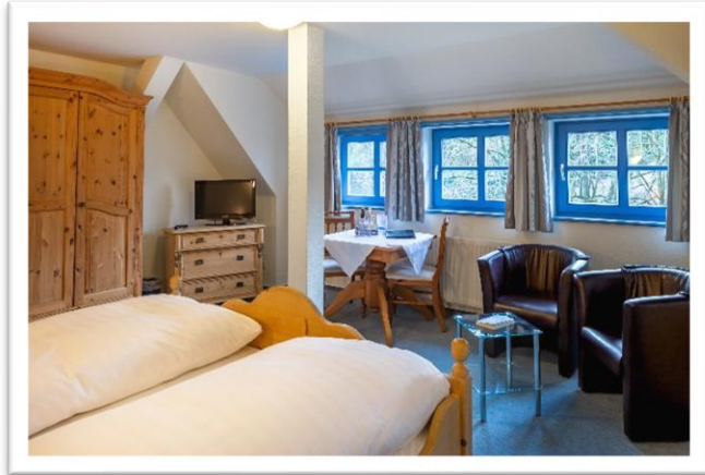
Beispiel: Landhaus Doppelzimmer